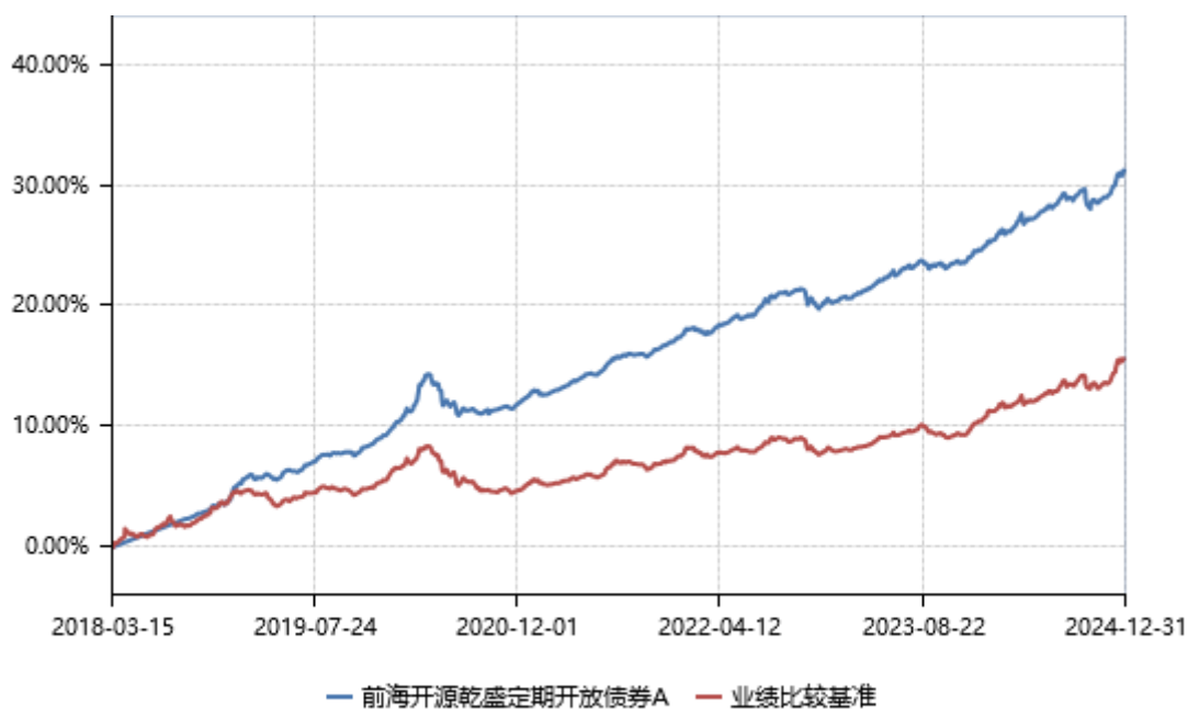
前海开源乾盛定期开放债券 C