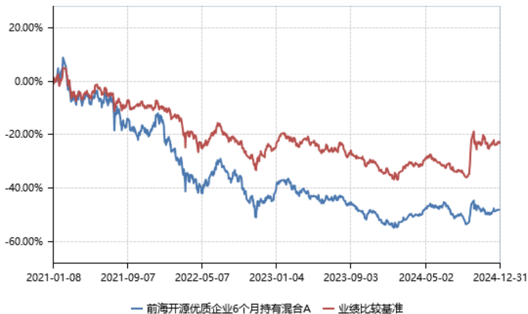
前海开源优质企业 6 个月持有混合 C