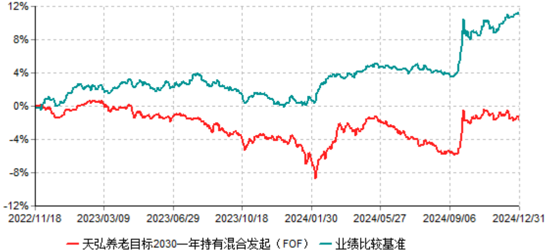
天弘养老目标2030一年持有混合发起（FOF）累计净值增长率与业绩比较基准收益率历史走势对比图 (2022年11月18日-2024年12月31日)