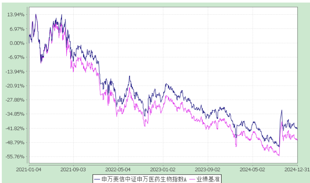
申万菱信中证申万医药生物指数 C