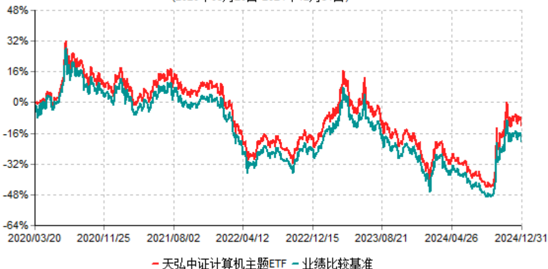
天弘中证计算机主题ETF累计净值增长率与业绩比较基准收益率历史走势对比图 (2020年03月20日-2024年12月31日)

注：1、本基金合同于2020年03月20日生效。 2、本报告期内，本基金的各项投资比例达到基金合同约定的各项比例要求。