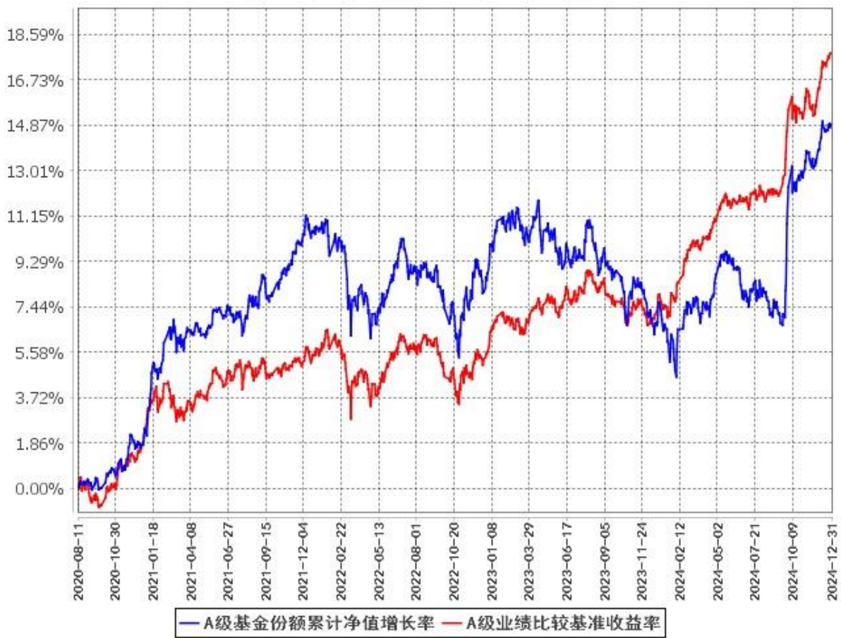
A级基金份额累计净值增长率与同期业绩比较基准收益率的历史走势对比图 (2020年8月11日至2024年12月31日)