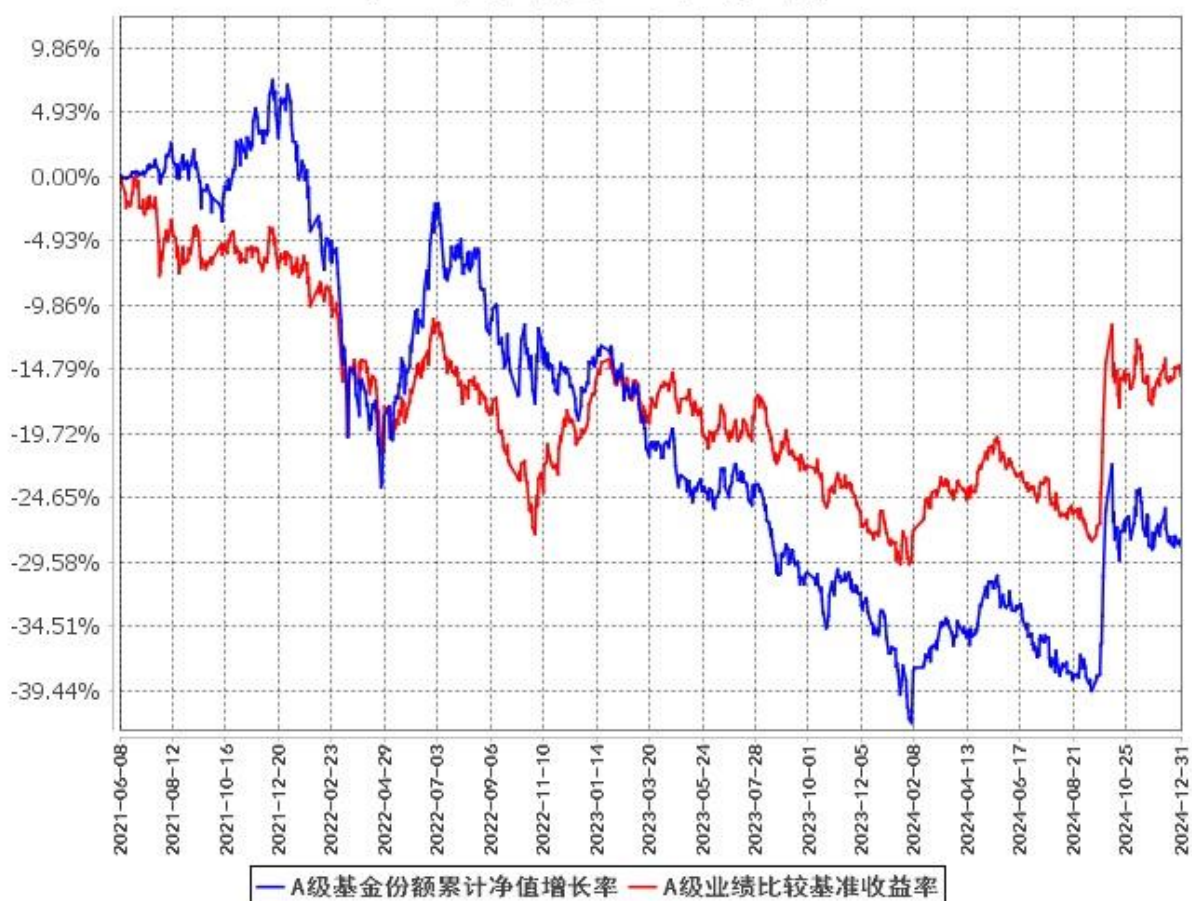
A级基金份额累计净值增长率与同期业绩比较基准收益率的历史走势对比图 (2021年6月8日至2024年12月31日)