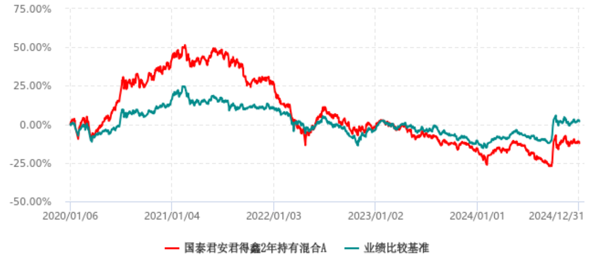
国泰君安君得鑫2年持有混合A累计净值增长率与业绩比较基准收益率历史走势对比图 (2020年01月06日-2024年12月31日)