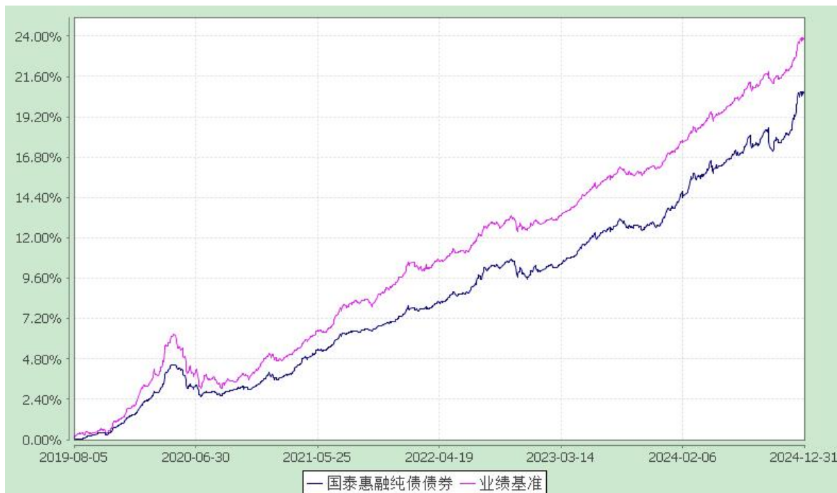
自基金合同生效以来份额累计净值增长率与业绩比较基准收益率的历史走势对比图 (2019 年 8 月 5 日至 2024 年 12 月 31 日)

注：本基金合同生效日为 2019 年 8 月 5 日，在六个月建仓期结束时，各项资产配置比例符合合同约定。