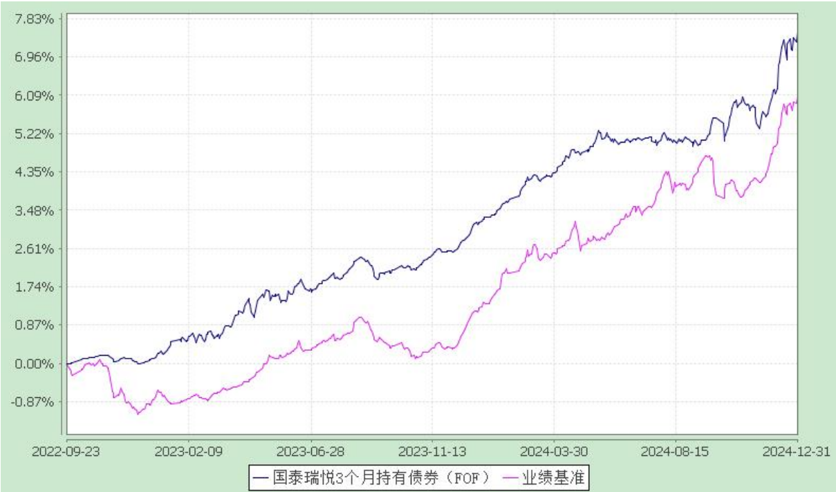
自基金合同生效以来份额累计净值增长率与业绩比较基准收益率的历史走势对比图 (2022 年 9 月 23 日至 2024 年 12 月 31 日)

注：本基金的合同生效日为 2022 年 9 月 23 日。本基金在 6 个月建仓期结束时，各项资产配置比例符合合同约定。