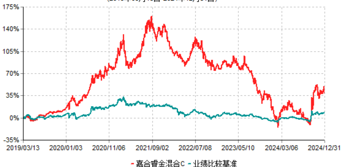
嘉合睿金混合C累计净值增长率与业绩比较基准收益率历史走势对比图 (2019年03月13日-2024年12月31日)

注：1、本基金于2019年3月13日由"嘉合睿金定期开放灵活配置混合型发起式证券投资基金"转型而来。