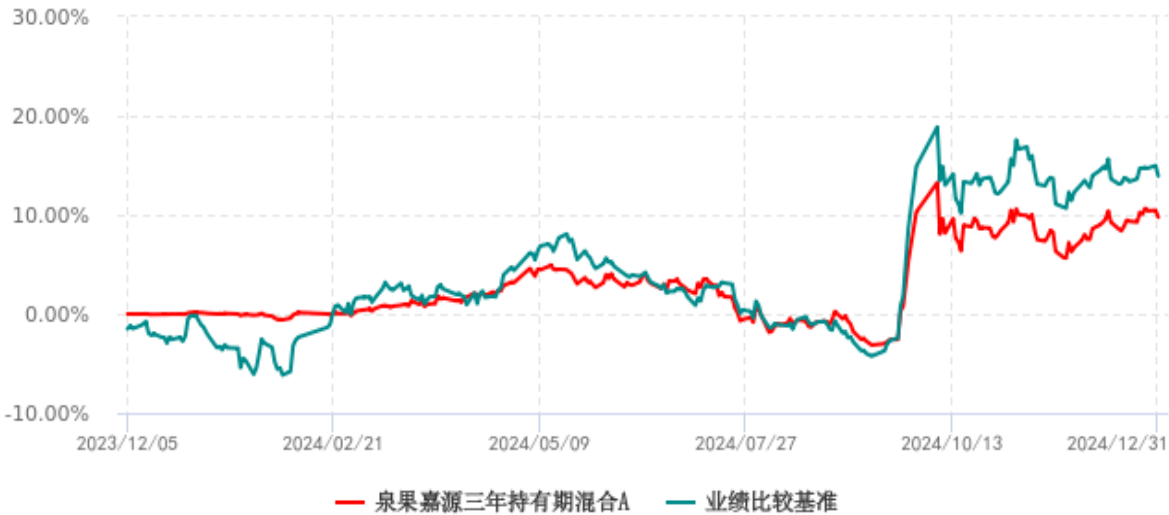
泉果嘉源三年持有期混合A累计净值增长率与业绩比较基准收益率历史走势对比图 (2023年12月05日-2024年12月31日)