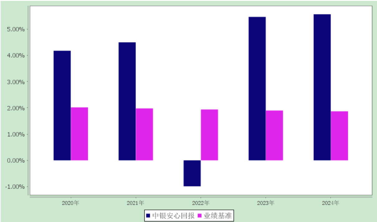
过去五年基金净值增长率与业绩比较基准收益率的对比图