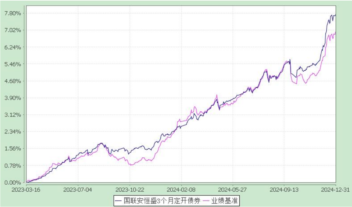
自基金合同生效以来份额累计净值增长率与业绩比较基准收益率的历史走势对比图 (2023 年 3 月 16 日至 2024 年 12 月 31 日)