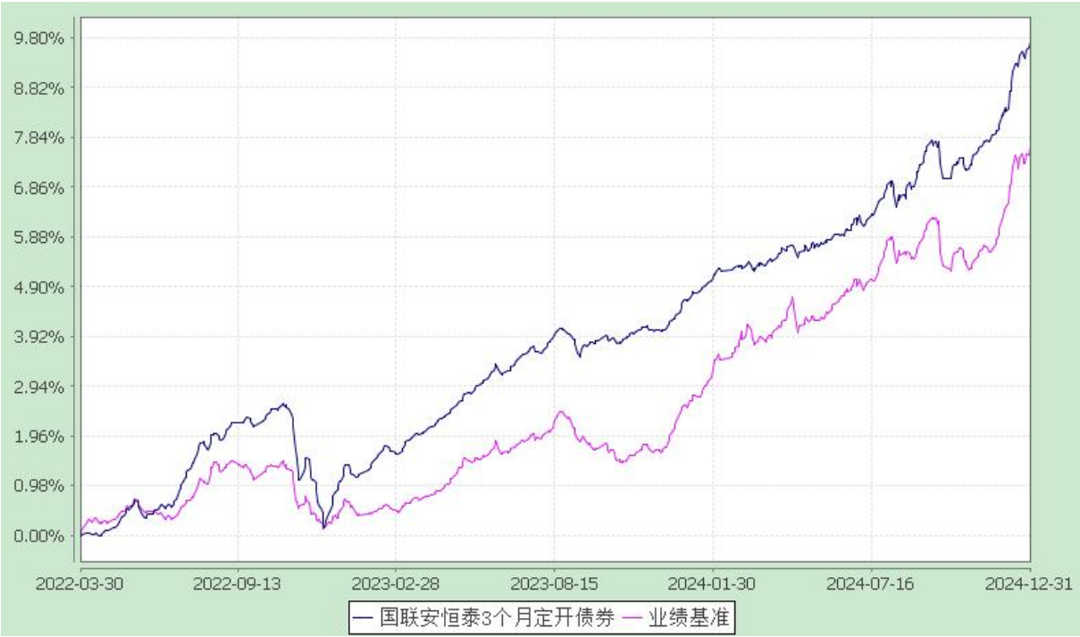
国联安恒泰 3 个月定期开放纯债债券型证券投资基金 自基金合同生效以来份额累计净值增长率与业绩比较基准收益率的历史走势对比图 (2022 年 3 月 30 日至 2024 年 12 月 31 日)

注：1、本基金业绩比较基准为中债综合指数收益率； 2、本基金基金合同于 2022 年 3 月 30 日生效； 3、本基金建仓期为自基金合同生效之日起的 6 个月，建仓期结束时各项资产配置符合合同约定。