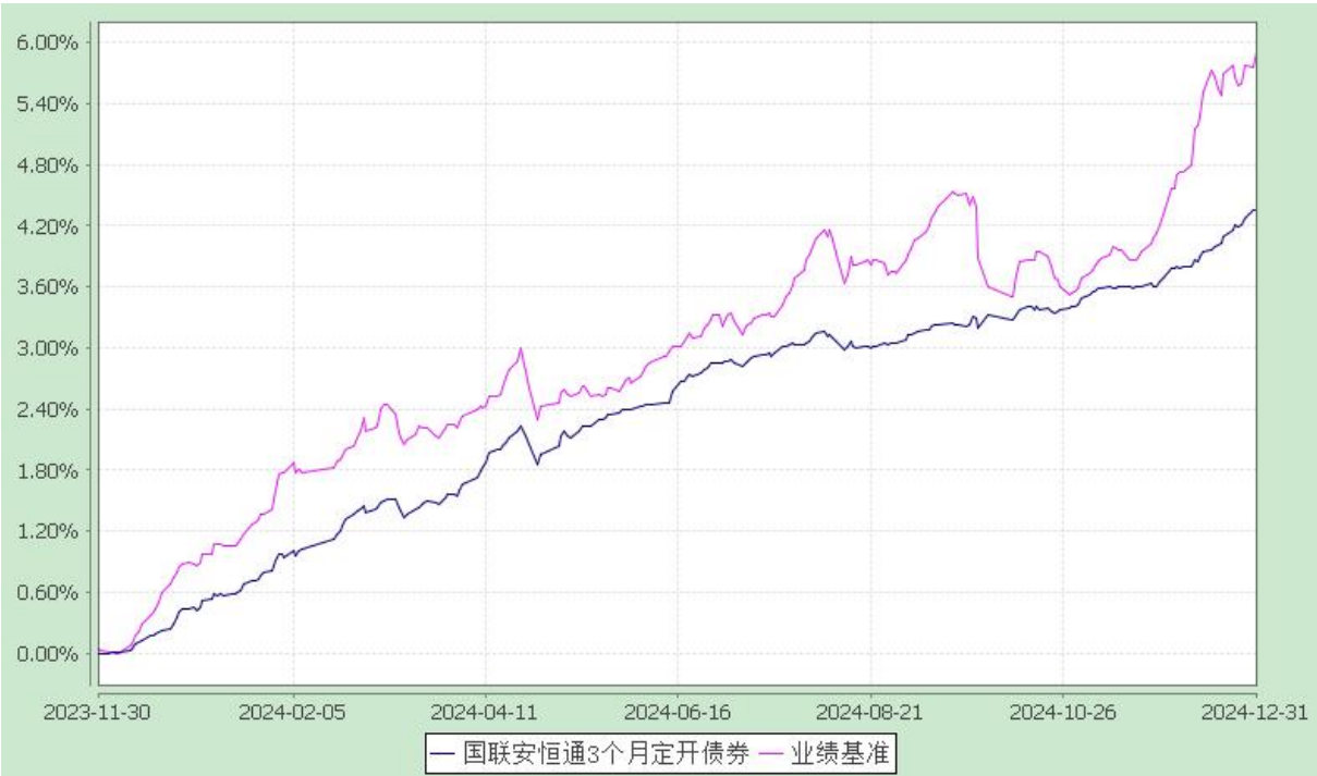
自基金合同生效以来份额累计净值增长率与业绩比较基准收益率的历史走势对比图 (2023 年 11 月 30 日至 2024 年 12 月 31 日)

注：1、本基金业绩比较基准为中债综合指数收益率； 2、本基金基金合同于 2023 年 11 月 30 日生效； 3、本基金建仓期为自基金合同生效之日起的 6 个月。本基金建仓期结束距本报告期末不满一年，建仓期结束时各项资产配置符合合同约定。