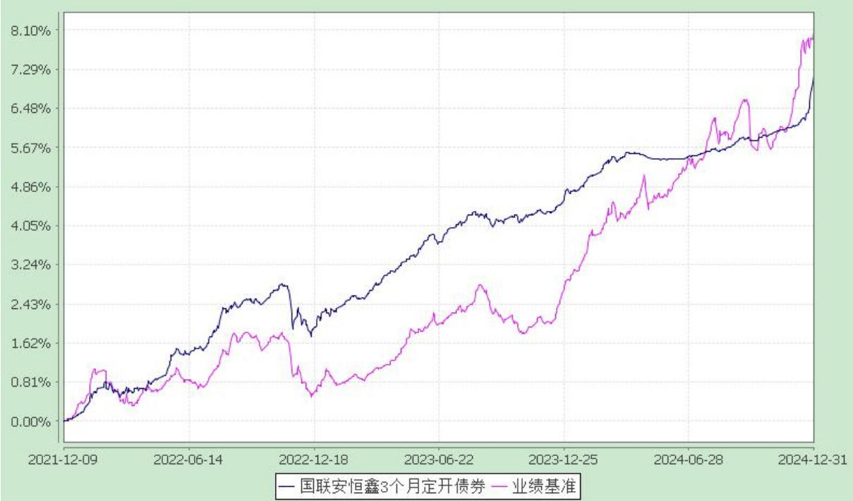
国联安恒鑫 3 个月定期开放纯债债券型证券投资基金 自基金合同生效以来份额累计净值增长率与业绩比较基准收益率的历史走势对比图 (2021 年 12 月 9 日至 2024 年 12 月 31 日)

注：1、本基金业绩比较基准为中债综合指数收益率； 2、本基金基金合同于 2021 年 12 月 9 日生效； 3、本基金建仓期为自基金合同生效之日起的 6 个月，建仓期结束时各项资产配置符合合同约定。