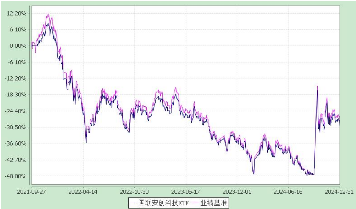
自基金合同生效以来份额累计净值增长率与业绩比较基准收益率的历史走势对比图 (2021 年 9 月 27 日至 2024 年 12 月 31 日)