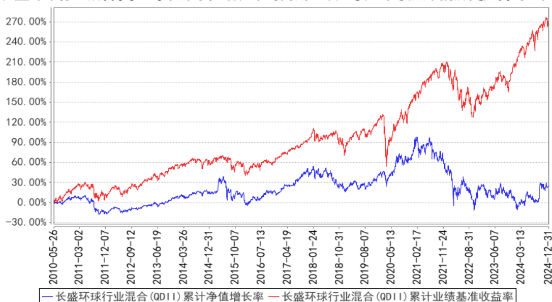
长盛环球行业混合(QDII)累计净值增长率与同期业绩比较基准收益率的历史走势对比图

注：按照本基金合同规定，基金管理人应当自基金合同生效之日起六个月内使基金的投资组合比例符合基金合同的约定。截至报告日，本基金的各项资产配置比例符合本基金合同的有关约定。