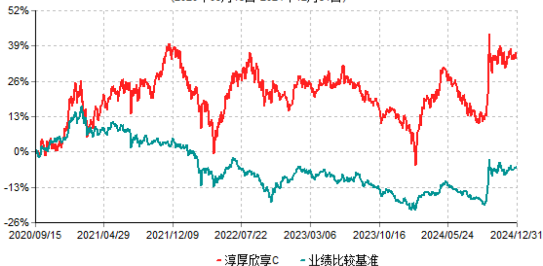
淳厚欣享C累计净值增长率与业绩比较基准收益率历史走势对比图 (2020年09月15日-2024年12月31日)

注：本基金基金合同生效日为2020年9月15日。按基金合同规定，本基金自基金合同生效起6个月内为建仓期。建仓期结束时本基金的各项投资比例均符合基金合同约定。