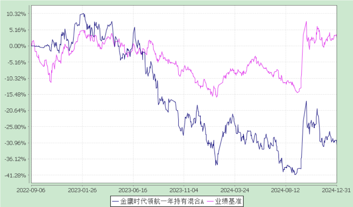
金鹰时代领航一年持有混合 A