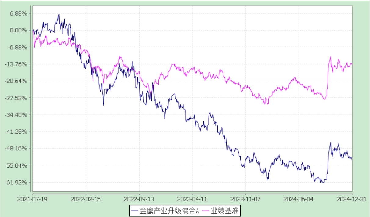
份额累计净值增长率与业绩比较基准收益率历史走势对比图 (2021 年 7 月 19 日至 2024 年 12 月 31 日)