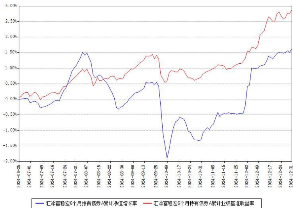
汇添富稳宏6个月持有债券A累计净值增长率与同期业绩基准收益率对比图