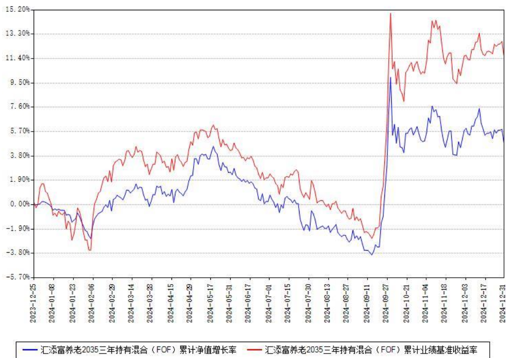
汇添富养老2035三年持有混合 (FOF) 累计净值增长率与同期业绩基准收益率对比图

注：本基金建仓期为本《基金合同》生效之日（2023年12月25日）起6个月，建仓期结束时各项资产配置比例符合合同约定。