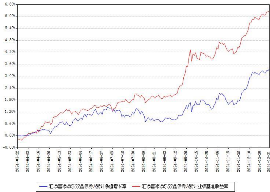
汇添富添乐双鑫债券A累计净值增长率与同期业绩基准收益率对比图