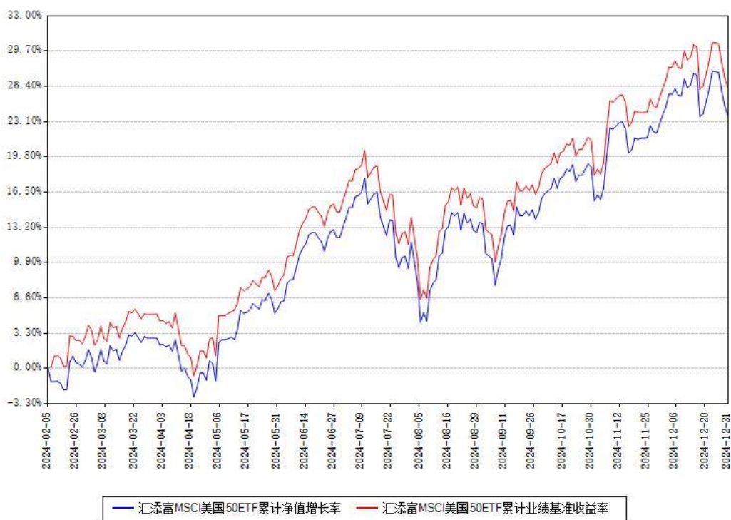
汇添富 MSCI 美国 50ETF 累计净值增长率与同期业绩比较基准收益率对比图

注：本《基金合同》生效之日为 2024 年 02 月 05 日，截至本报告期末，基金成立未满一年。本基金建仓期为本《基金合同》生效之日起 6 个月，截至本报告期末，本基金已完成建仓，建仓期结束时各项资产配置比例符合合同约定。本基金各类份额自实际有资产之日起披露业绩数据。