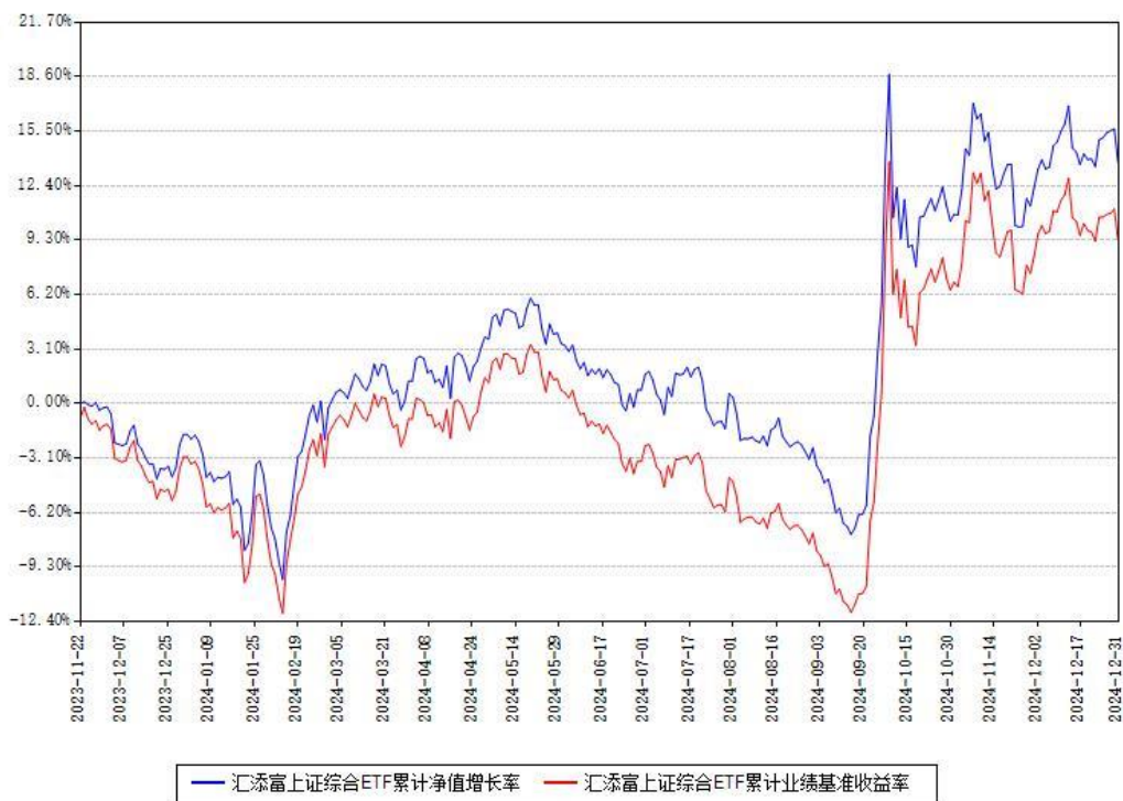
汇添富上证综合ETF累计净值增长率与同期业绩基准收益率对比图

注：本基金建仓期为本《基金合同》生效之日（2023 年 11 月 22 日）起 6 个月，建仓期结束时各项资产配置比例符合合同约定。