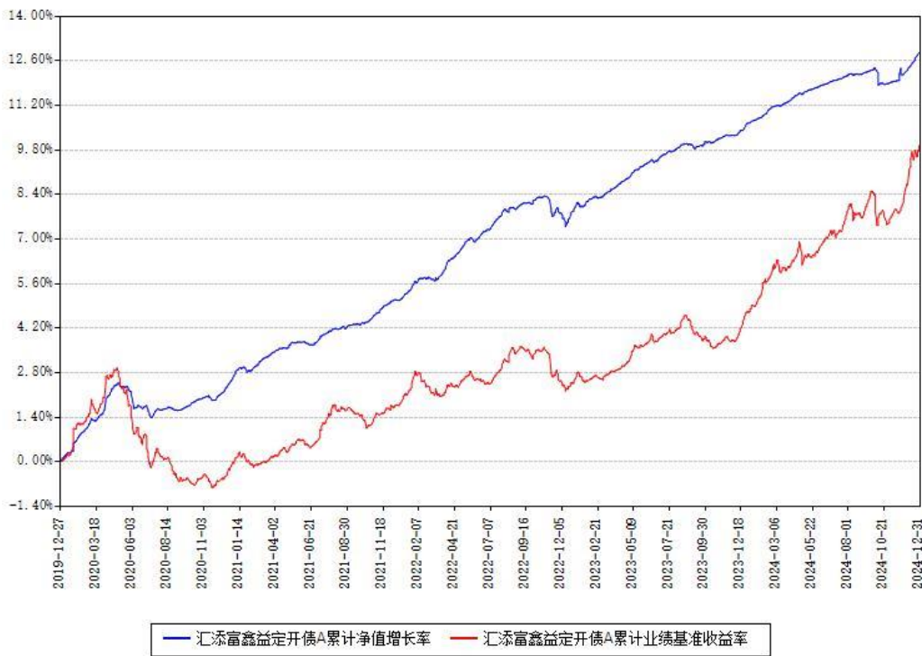
汇添富鑫益定开债A累计净值增长率与同期业绩基准收益率对比图