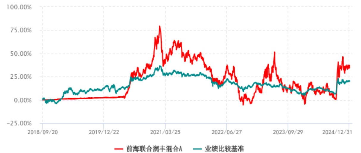
前海联合润丰混合A累计净值增长率与业绩比较基准收益率历史走势对比图 (2018年09月20日-2024年12月31日)

注：本基金的业绩比较基准为沪深 300 指数收益率×50%＋中债综合全价指数收益率×50%。