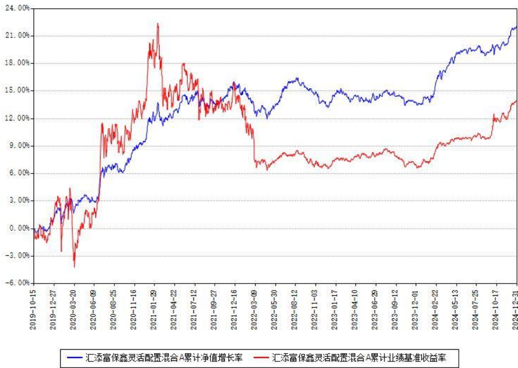
汇添富保鑫灵活配置混合A累计净值增长率与同期业绩基准收益率对比图