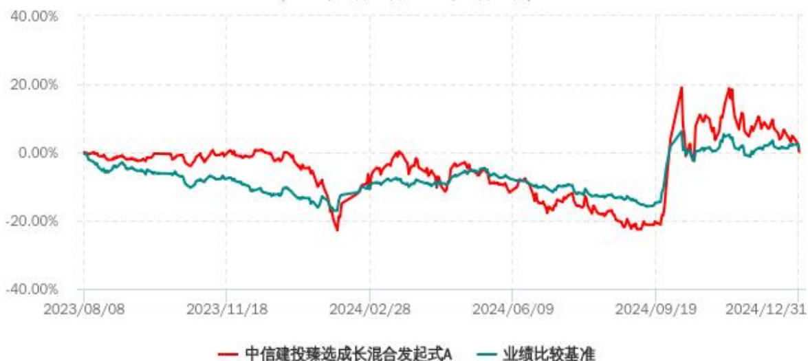
中信建投臻选成长混合发起式C累计净值增长率与业绩比较基准收益率历史走势对比图