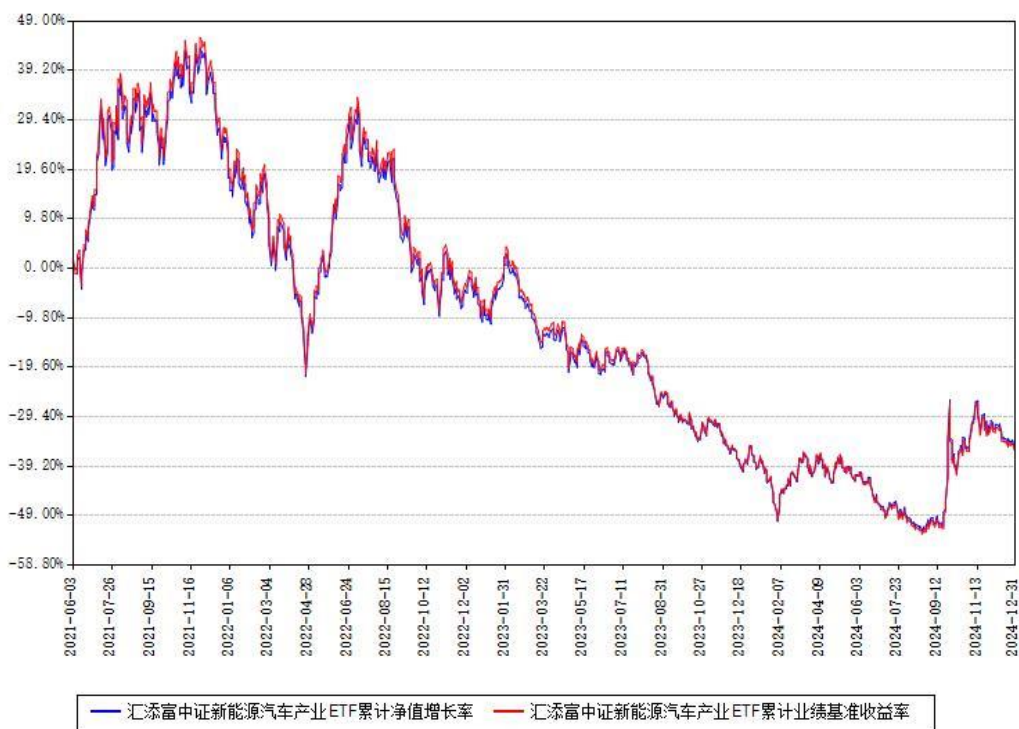
汇添富中证新能源汽车产业ETF累计净值增长率与同期业绩比较基准收益率对比图

注：本基金建仓期为本《基金合同》生效之日（2021年06月03日）起6个月，建仓期结束时各项资产配置比例符合合同约定。