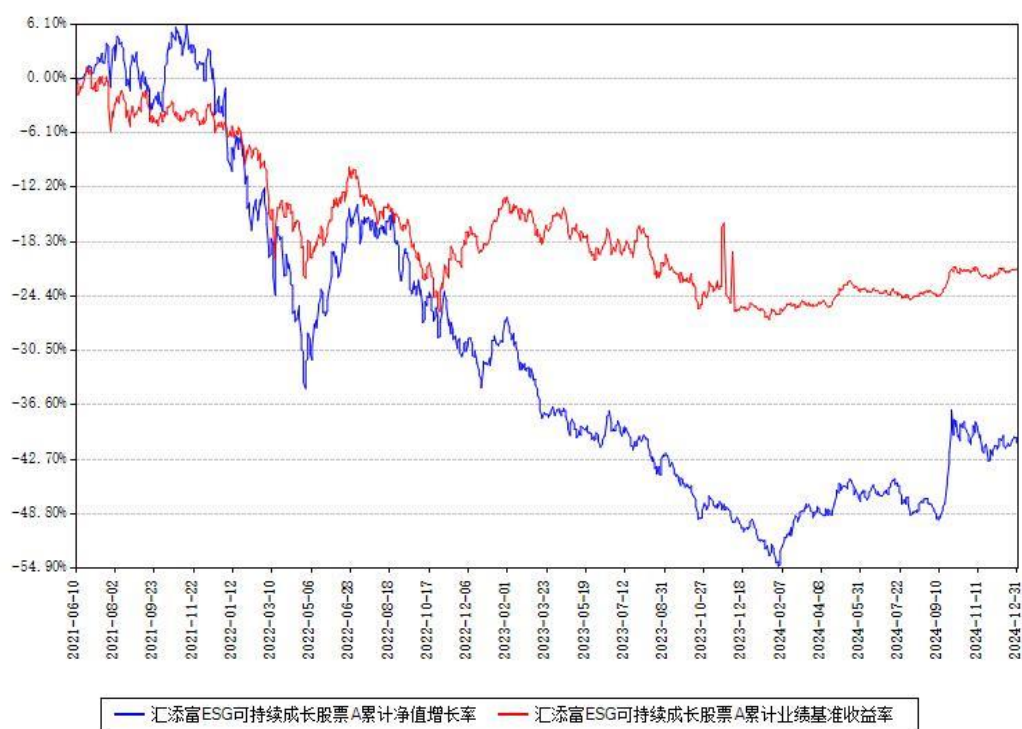
汇添富 ESG 可持续成长股票 C 累计净值增长率与同期业绩基准收益率对比图