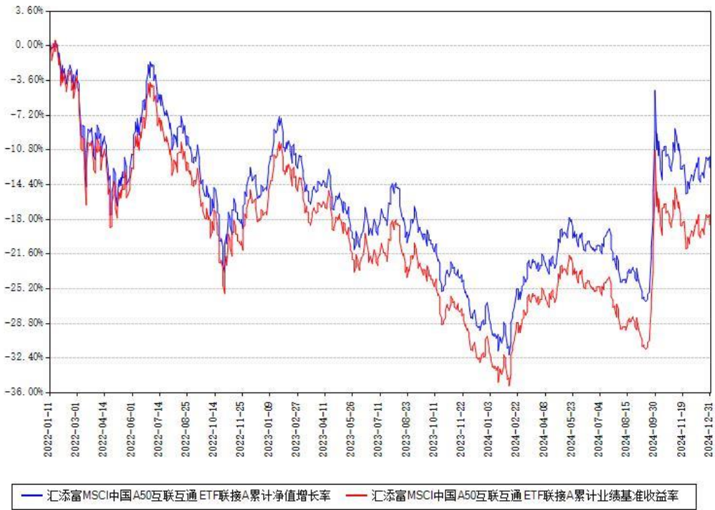
汇添富MSCI中国A50互联互通ETF联接A累计净值增长率与同期业绩基准收益率对比图