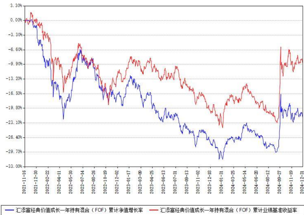
汇添富经典价值成长一年持有混合（FOF）累计净值增长率与同期业绩基准收益率对比图

注：本基金建仓期为本《基金合同》生效之日（2021年11月16日）起6个月，建仓期结束时各项资产配置比例符合合同约定。