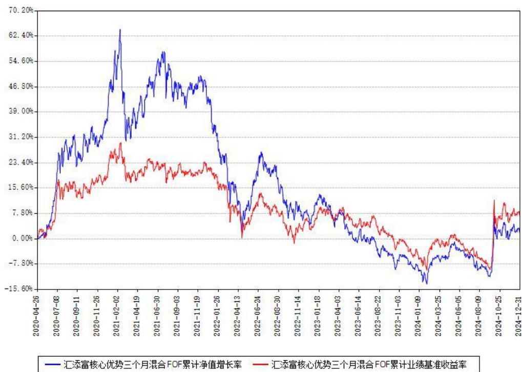
汇添富核心优势三个月混合FOF累计净值增长率与同期业绩基准收益率对比图

注：本基金建仓期为本《基金合同》生效之日（2020年04月26日）起6个月，建仓期结束时各项资产配置比例符合合同约定。