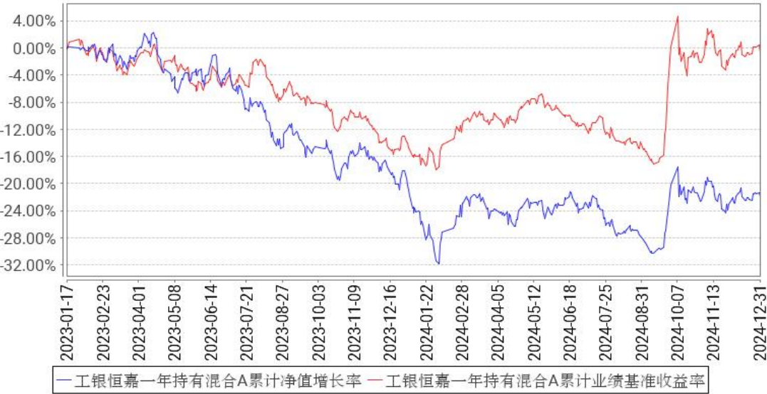
工银恒嘉一年持有混合A累计净值增长率与同期业绩比较基准收益率的历史走势对比图