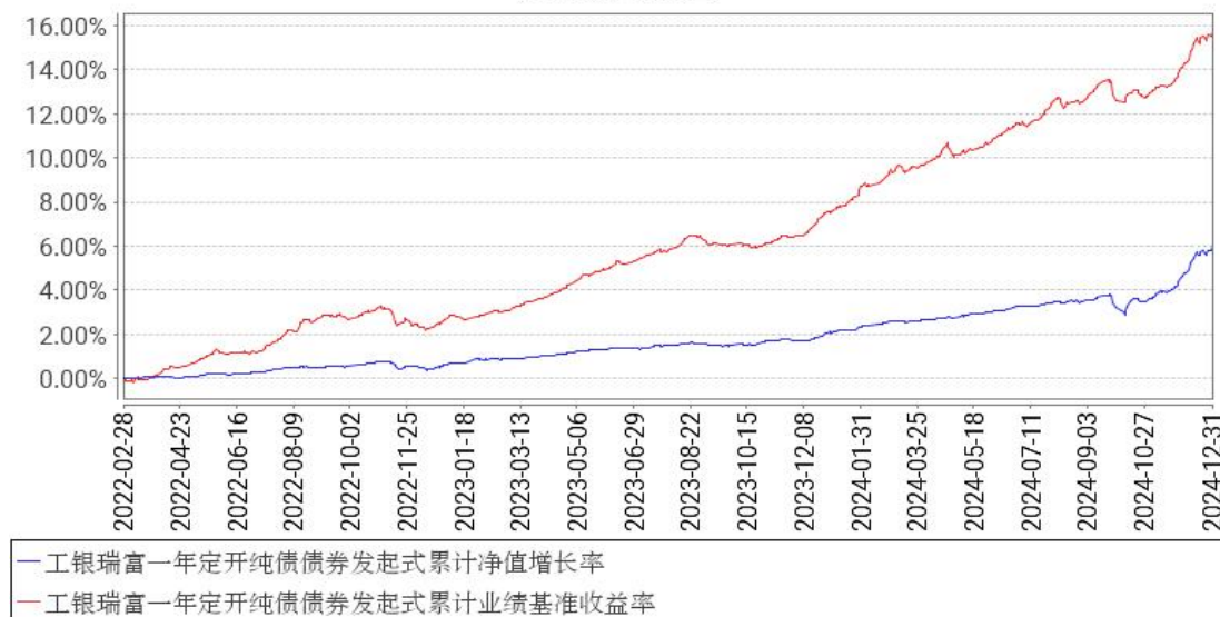
工银瑞富一年定开纯债债券发起式累计净值增长率与同期业绩比较基准收益率的历史走势对比图