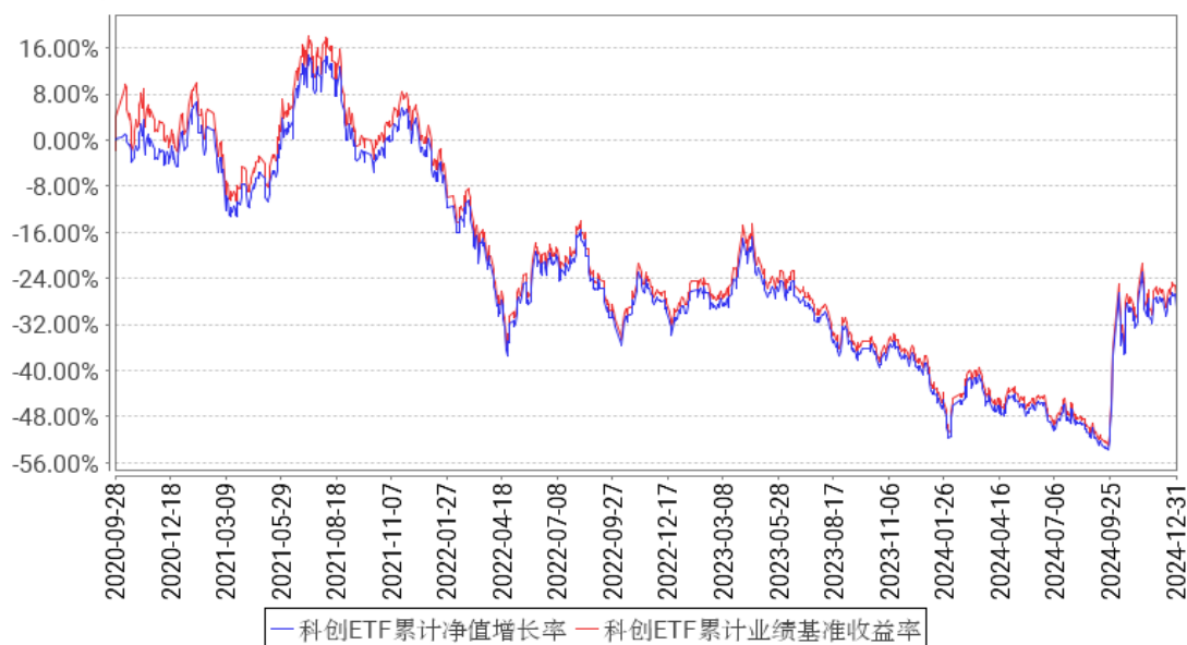
科创ETF累计净值增长率与同期业绩比较基准收益率的历史走势对比图