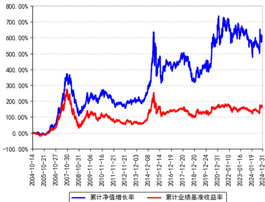
南方积极配置混合（LOF）累计净值增长率与同期业绩比较基准收益率的历史走势对比图