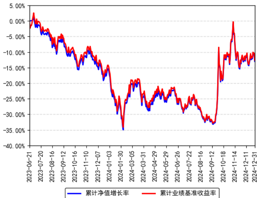
南方中证国新央企科技引领ETF累计净值增长率与同期业绩比较基准收益率的历史走势对比图