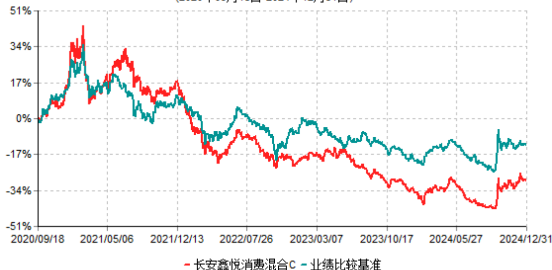
长安鑫悦消费混合C累计净值增长率与业绩比较基准收益率历史走势对比图 (2020年09月18日-2024年12月31日)

根据基金合同的规定,自基金合同生效之日起6个月内基金各项资产配置比例需符合基金合同要求。本基金在建仓期结束后,各项资产配置比例已符合基金合同有关投资比例的约定。本基金于2020年09月18日成立,基金合同生效日至报告期末,本基金运作时间已满一年。图示日期为2020年09月18日至2024年12月31日止。