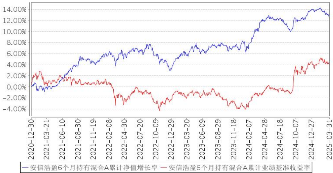
安信浩盈6个月持有混合A累计净值增长率与同期业绩比较基准收益率的历史走势对比图