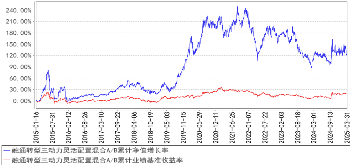
融通转型三动力灵活配置混合A/B累计净值增长率与同期业绩比较基准收益率的历史走势对比图