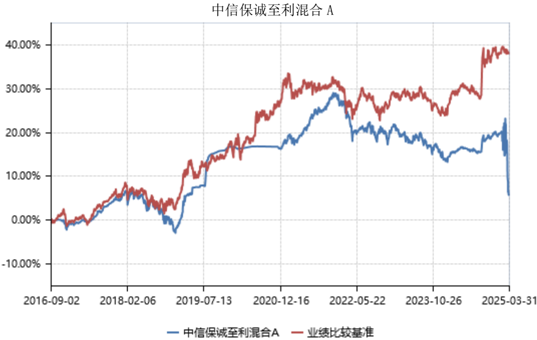
中信保诚至利混合 C