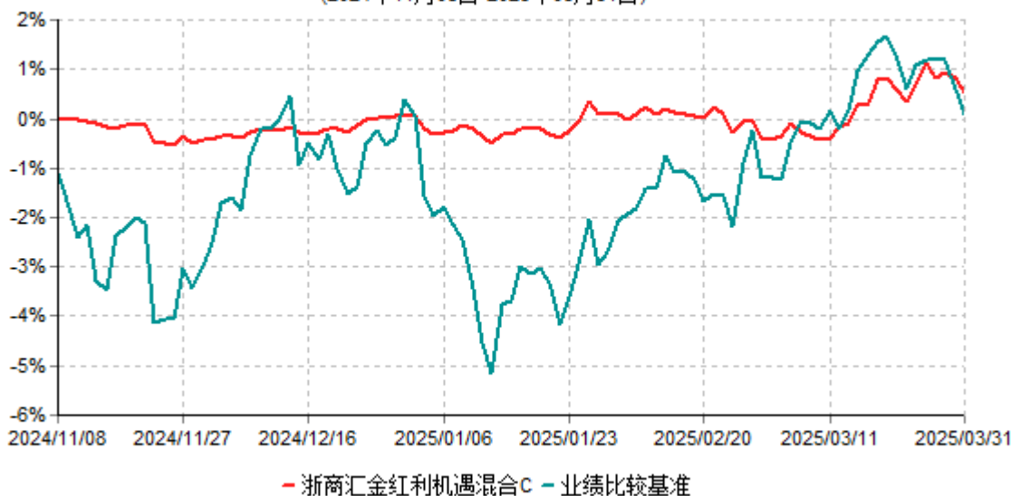
浙商汇金红利机遇混合C累计净值增长率与业绩比较基准收益率历史走势对比图 (2024年11月08日-2025年03月31日)

注：本基金的基金合同生效日为2024年11月08日，自基金合同生效日起至本报告期末不满一年，至本报告期末，本基金尚未完成建仓。