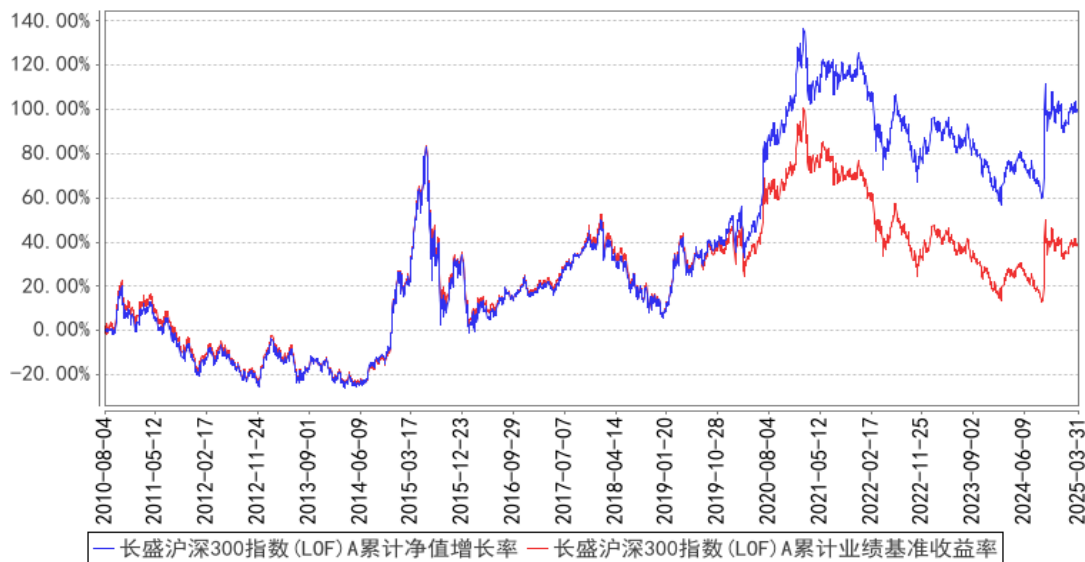
长盛沪深300指数(LOF)A累计净值增长率与同期业绩比较基准收益率的历史走势对比图