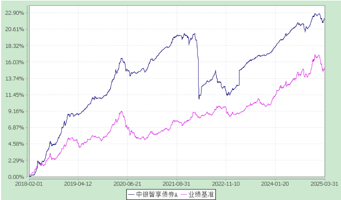
中银智享债券型证券投资基金 累计净值增长率与业绩比较基准收益率的历史走势对比图 (2018 年 2 月 1 日至 2025 年 3 月 31 日)