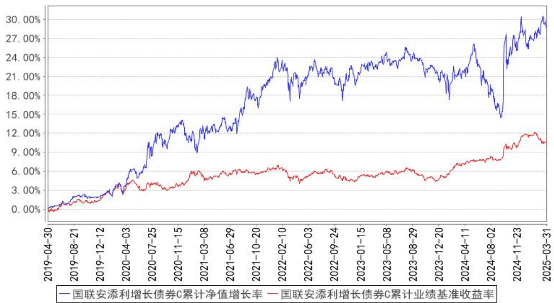
国联安添利增长债券C累计净值增长率与同期业绩比较基准收益率的历史走势对比图

注：1、本基金的业绩比较基准为：中债综合指数收益率×90%+沪深 300 指数收益率×10%； 2、本基金基金合同于 2019 年 4 月 30 日生效； 3、本基金建仓期为自基金合同生效之日起的 6 个月，建仓期结束时各项资产配置符合合同约定。