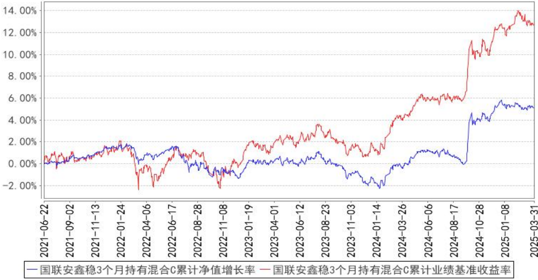
国联安鑫稳3个月持有混合C累计净值增长率与同期业绩比较基准收益率的历史走势对比图

注：1、本基金业绩比较基准为沪深 300 指数收益率×15%+恒生指数收益率×5%+中证全债指数收益率×80%； 2、本基金基金合同于 2021 年 6 月 22 日生效； 3、本基金建仓期为自基金合同生效之日起的 6 个月，建仓期结束时各项资产配置符合合同约定。